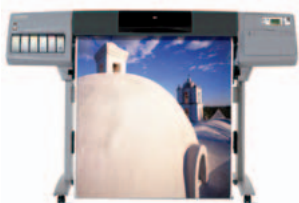
stampante hp designjet 5500 (serie 42")